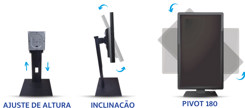
AJUSTE DE ALTURA